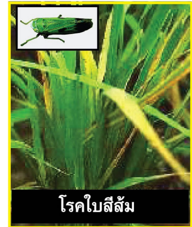
โรคใบสีส้ม

โรคใบสีส้ม มีเพลี้ยจักจั่นสีเขียว เป็นพาหะนำโรค ใบข้าวจะเริ่มมีสีเขียวสลับเหลืองต่อมาจะเปลี่ยนเป็นสีเหลืองเริ่มจากปลายใบเข้าหาโคนใบ ต้นเตี้ยแคระแกรน ลำต้นสั้น รวงเล็ก หรือไม่ออกรวง